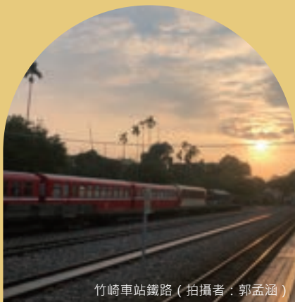
竹崎車站鐵路