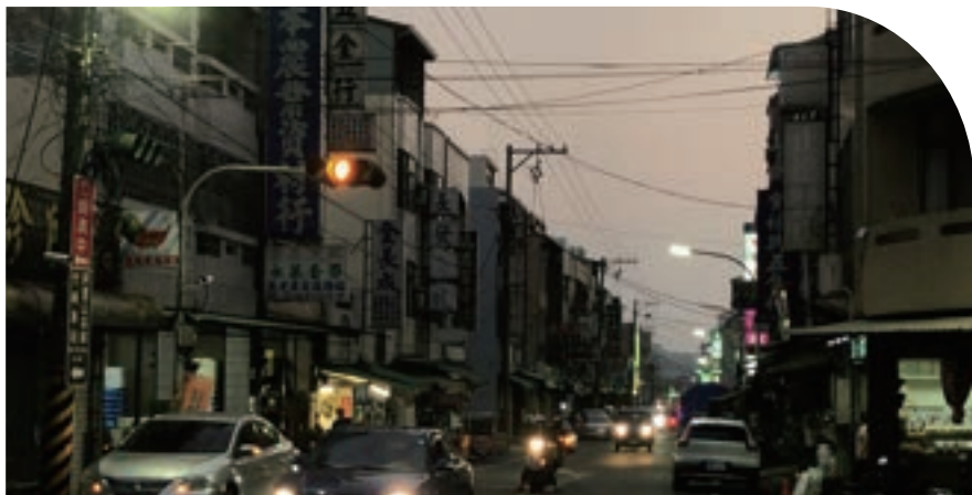
現今竹崎車站旁的街頂仔

清代廟宇及市場集中於頂街，林鐵通車後，竹崎車站也設置於此，因此成為最熱鬧的區域，顯示了林鐵與竹崎城鎮繁榮的密切。但隨著臺灣各地公路建設完善，公路運輸逐漸取代鐵路運輸的地位，竹崎車站所在的「頂街仔」逐漸沒落。