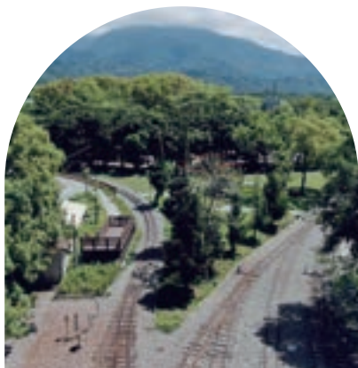
竹崎車站三角線

1912年(大正元年)林鐵通車初期，竹崎車站與二萬平車站分別為登山線的起點與終點，為了讓機車頭能夠轉向，因此在車站東端規劃一個三角線，運用車輛T字形迴轉的原理，來進行車頭轉向。形成特殊的火車調頭景象，可惜在1920年(大正9年)登山線確定以車頭固定在列車尾端後推上山之後，三角線逐漸失去重要性。實地走訪竹崎車站時，不妨仔細尋找，看看這特殊的三教線景觀。