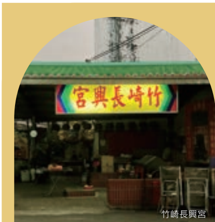
伯公廟與客家移民

各個地方皆有當地的信仰，位於竹崎街面恭奉土地公的長興宮，不僅是當地重要的信仰中心，也述說著竹崎林鐵開發與居民移入的歷史。