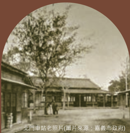
北門車站老照片