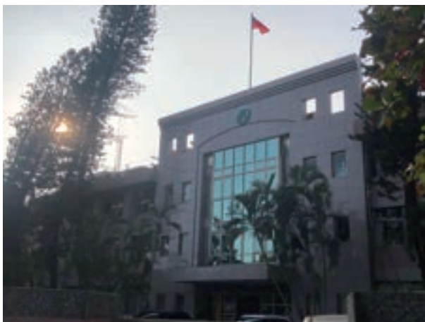
林業及自然保育署嘉義分署