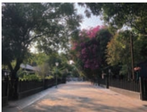
2023年檜意森活村街道景象

生活在宿舍的林場人享受著便利的生活機能，不僅住所鄰近工作地點，就連學區也在附近：營林俱樂部在戰後一度作為「忠孝幼稚園」，而日治時期就已在檜町興建的多所學校，從小學、中學、高中到專科學校皆有，供生活在林場宿舍的孩子們就學。因為點與點之間的移動距離非常近，甚至走路不用幾分鐘，在現今看來可說是非常搶手的精華地段！