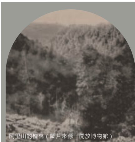
阿里山的檜林