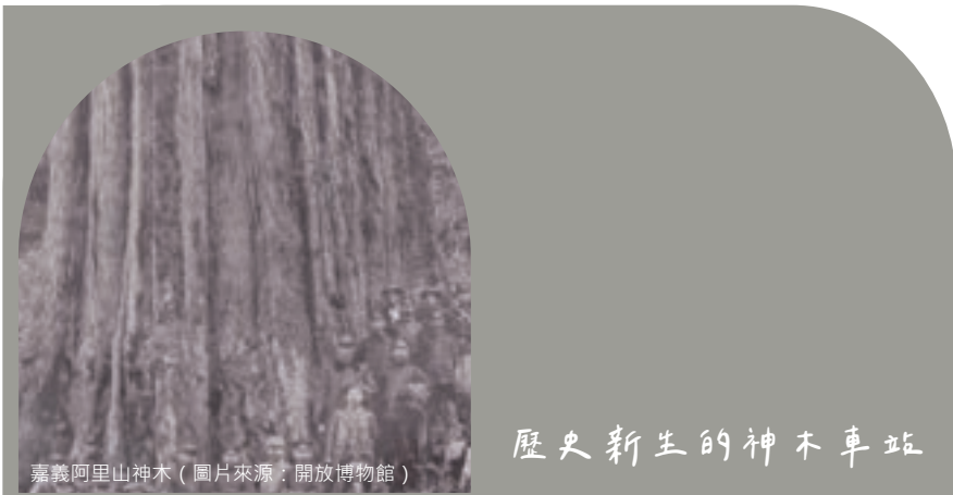
嘉義阿里山神木