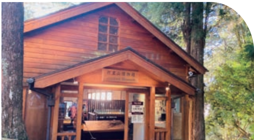
■ ■ ■ 阿里山博物館

後於1935年(昭和10年)，在日本統治臺灣40週年的慶典—始政四十年博覽會的時空背景下，此地又興建了高山博物館，專門展示高山相關之地理、動植物資訊，以展示日本當時對阿里山及新高山的調查成果。此建築物一直保留至今，並於2007年(民國96年)重新進行整修，改名為阿里山博物館，重見於遊客面前。現在館內以森林鐵道、早期伐木史及林場保育等特色主題佈展，展示早期阿里山地圖、木頭標本、伐木工具、鐵道文物模型及珍貴歷史照片等，彙整了阿里山的重要歷史。這裡亦是此趟走讀的終點站，穿越千年古木巨林，我們也穿越了不同的時空，最後又停駐在時空留下的古老檜木建築中。從古至今，神社傾頹，寺廟更名，博物館還是博物館，這趟路徑匯集了森林、林業與信仰的變遷，見證了阿里山的古往今昔。