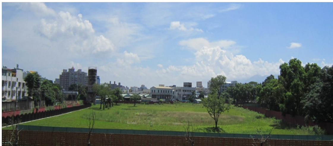
林業藝術園區第一期景觀改善工程