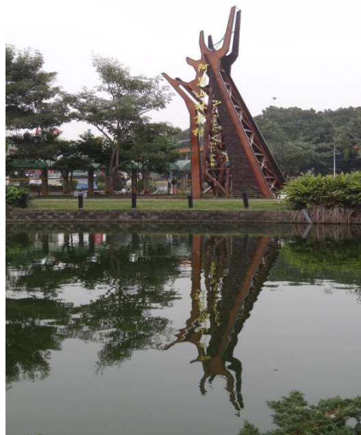
杉池意象修景工程