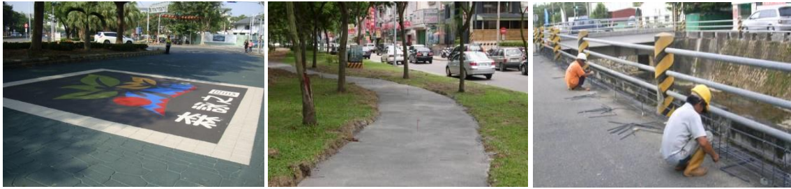
阿里山入口意象－北門驛、阿里山林業村及檜意森活村等三處縫合工程